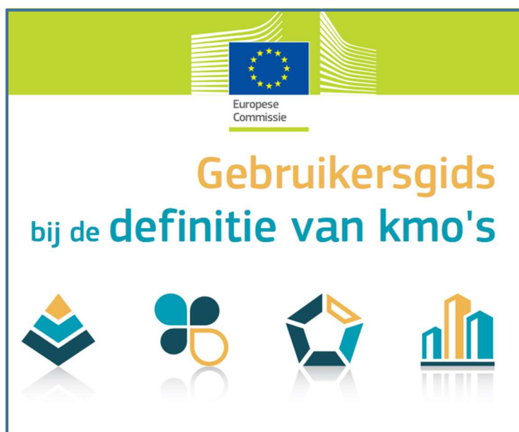
Afbeelding: titelpagina van de EU gebruikersgids

De exacte definitie van wat "één werknemer" is, is ook vastgelegd. Bijvoorbeeld, hoe hard tellen parttimers 4 en uitzendkrachten en stagiaires mee, hoe diegenen die pas halverwege het jaar instromen, hoe om te gaan met zwangerschapsverlof, meewerkende eigenaren, etc.? En hoe tellen dochterondernemingen mee, investeerders, en andere juridische constructies? Het valt buiten de doelstelling van dit artikel om dit allemaal precies uit te leggen. Maar dat hoeft ook niet, de EU heeft hierover een goed leesbaar document 5 opgesteld: "Gebruikersgids bij de definitie van kmo's". Ook is er de website van de RVO 6 die kan helpen.