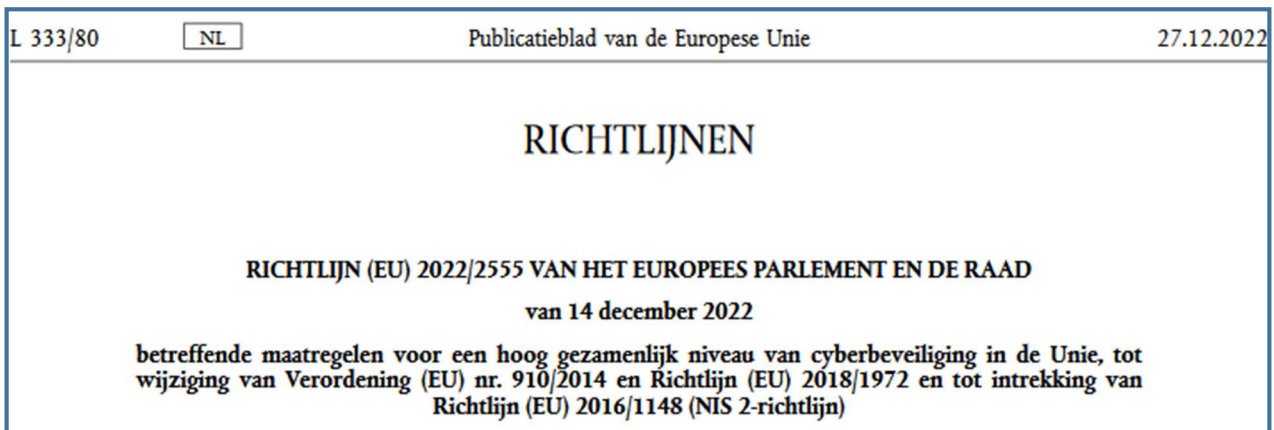
Figuur: Titelblad NIS

Eind 2022 is vanuit Brussel de “NIS2 Richtlijn” (Network & Information Systems) uitgekomen, en 3 weken na publicatie geactiveerd. Als opvolger van de oudere “NIS” (in het Nederlands: Wbni – Wet Beveiliging Netwerken en Infrastructuur) gaat het de eisen op het gebied van cybersecurity van bedrijven aanscherpen.